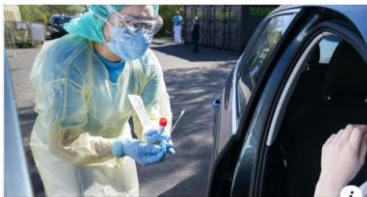
DR.DK Tal viser det, og forsker understreger det: Coronavirus er hårdest ved overvægtige

https://www.dr.dk/nyheder/indland/tal-viser-det-og-forsker-understreger-det-coronavirus-er-haardest-ved-