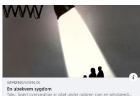
WEEKENDAVISEN.DK En ubekvem sygdom Tabu: Svært overvægtige er glet under radaren som en selvstændig...

https://www.weekendavisen.dk/2020-20/samfund/en-ubekvem-