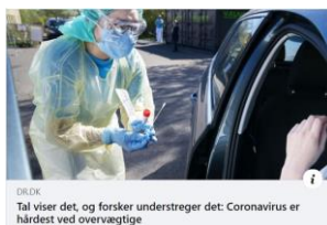
DR.DK Tal viser det, og forsker understreger det: Coronavirus er hårdest ved overvægtige

https://www.dr.dk/nyheder/indland/tal-viser-det-og-forsker-understreger-det-coronavirus-er-